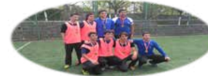
FUTBOL TURNUVASI ŞAMPİYONU 10. SINIFLAR