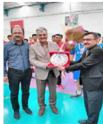
Melikgazi ilçesi 12. Bölge okulları arasında yapılan Voleybol ve Masa Tenisi turnuvasında öğrencilerimiz okulumuzu başarıyla temsil etmişlerdir.