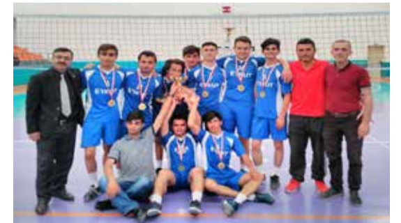
12. BÖLGE OKULLARI VOLEYBOL TURNUVASI ŞAMPİYONU KİLİM SOSYAL BİLİMLER LİSESİ