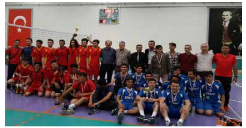
TURNUVAYA KATILAN TÜM TAKIMLAR DOSTÇA MÜCADELE ETTİLER