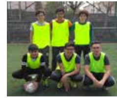
FUTBOL TURNUVASI İKİNCİSİ HAZIRLIKLAR