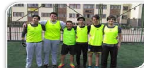
FUTBOL TURNUVASI ÜÇÜNCÜSÜ 9. SINIFLAR