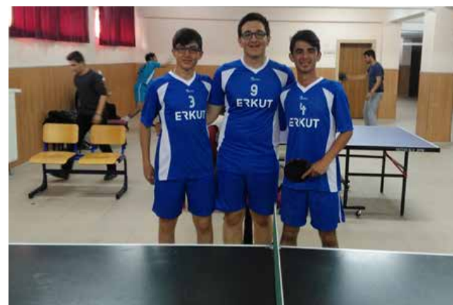
12. BÖLGE OKULLARI MASA TENİSİ TURNUVASI İKİNCİSİ KİLİM SOSYAL BİLİMLER LİSESİ