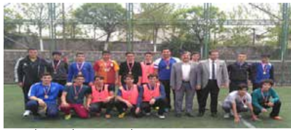
OKUL İDAREMİZ TÜM FAALİYETLERDE ÖĞRENCİLERİMİZİN YANINDA

Sınıflar arası futbol turnuvası çok çekişmeli ve zevkli maçlara sahne oldu. Turnuva boyunca öğrencilerimiz kıyasıya mücadele ettiler. Turnuvada kazanmaktan çok sportmenlik ve kardeşlik ön plana çıktı. Müsabakalar sonucunda; 9. Sınıflar üçüncü Hazırlıklar ikinci olurken 10. Sınıflar şampiyon oldular.